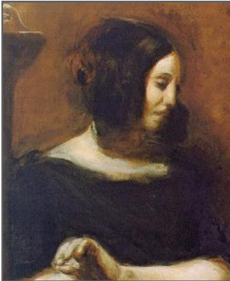
Portrait de Delacroix